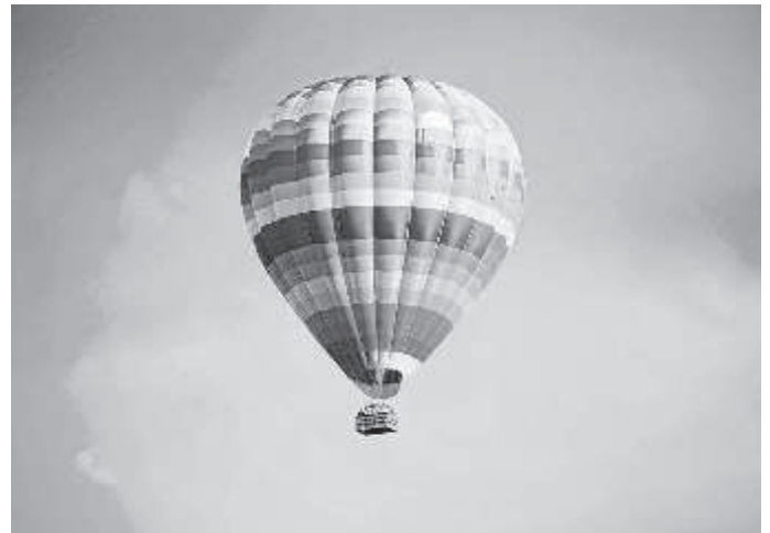
mit Ballonfahrverlosung, Start 18:00 Uhr Nur wer anwesend ist, kann gewinnen