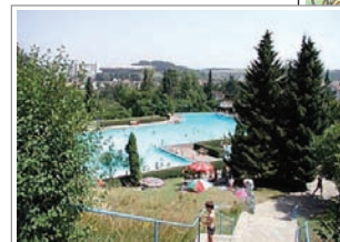
Waldfreibad mit Gaststätte und Minigolfanlage