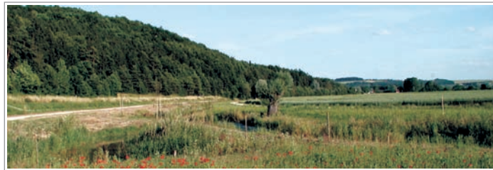
Schmiechtal - Allmendinger Ried