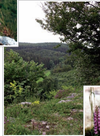
Blick vom Nägelesstein