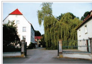
Schloss, 16. Jahrhundert